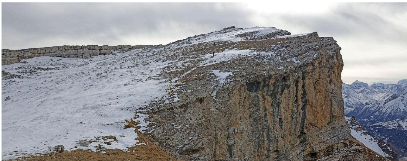
Рис. 7 Участок R4-R5