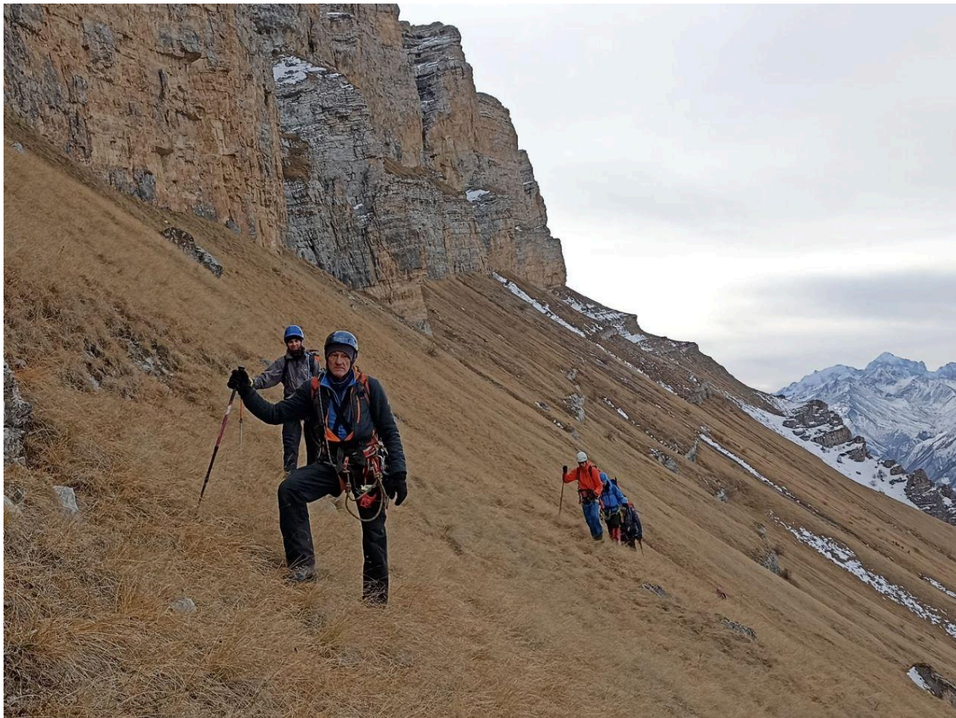
Рис.3 Крутой травянистый склон на R0-R1