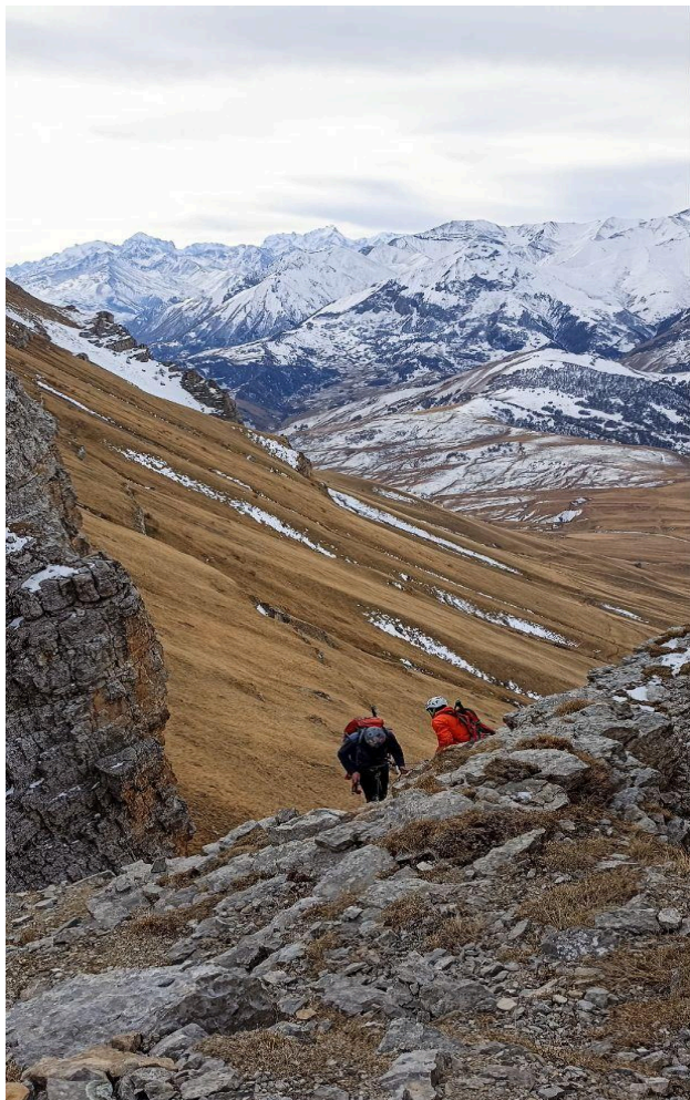
рис.4 вид на станцию R2, после ключевого участка, далее травянисто осыпной склон