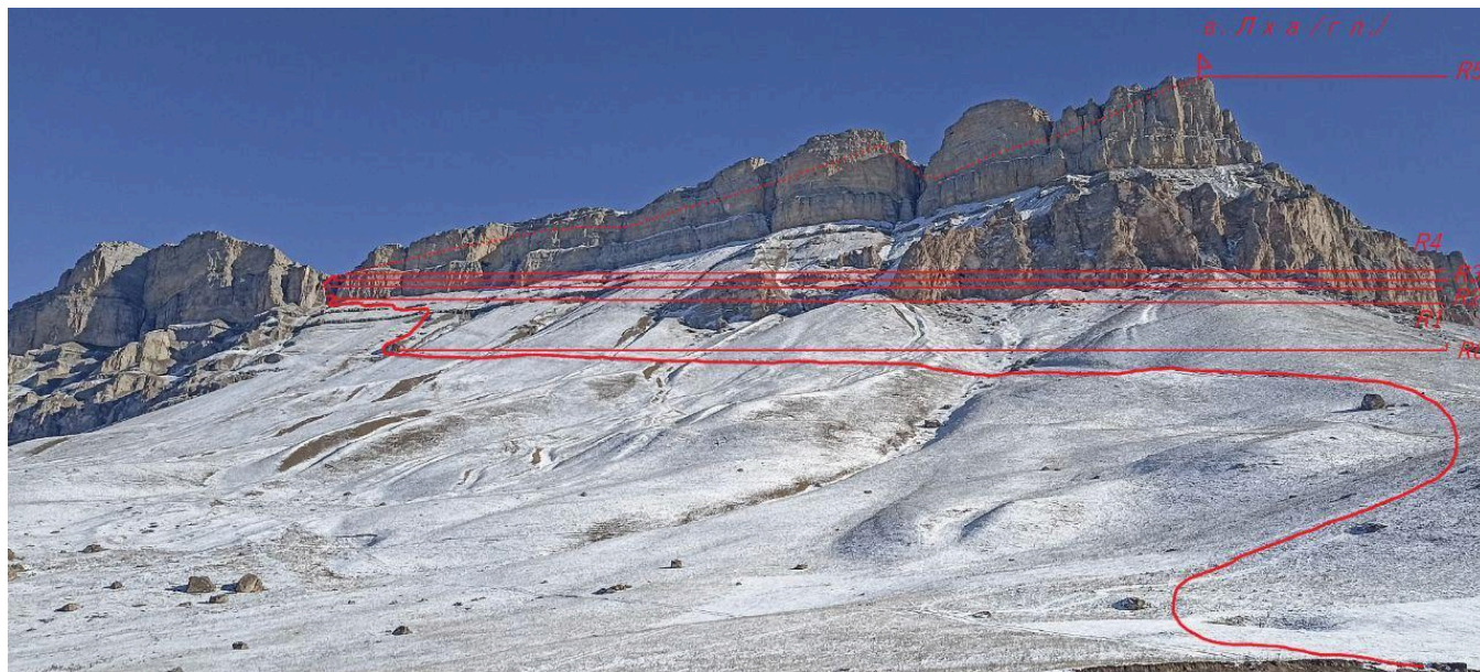
Рис.1. Нитка маршрута, общий вид на в. Лха, Главная