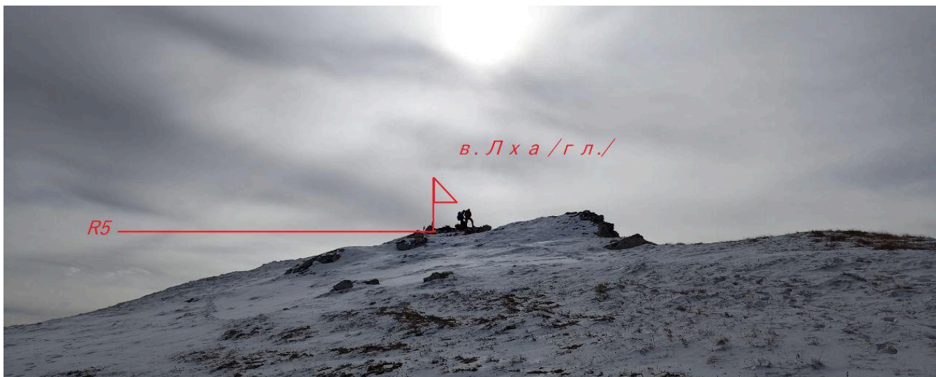
Рис. 8 в. Лха, Главная, R5