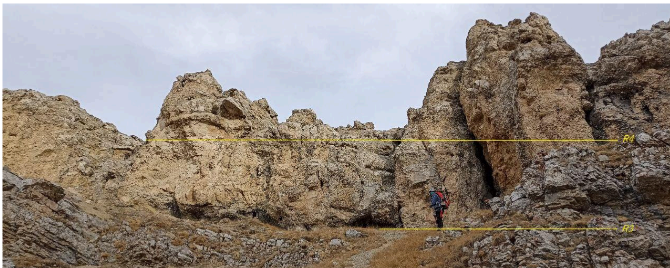
рис 6. участок R3-R4