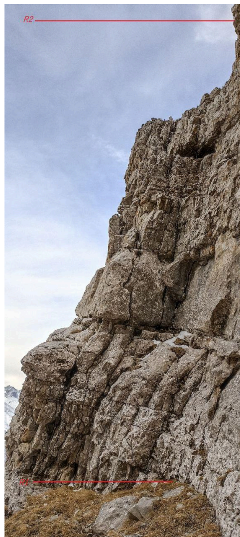
рис.5 участок R1-R2