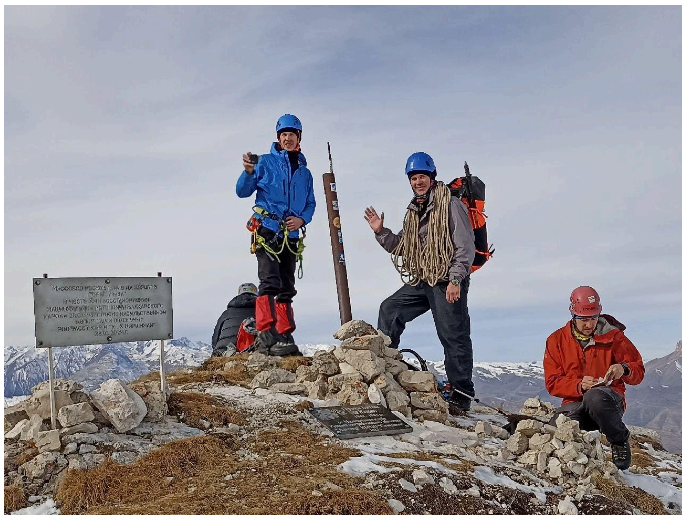
Рис. 9 Фото на вершине