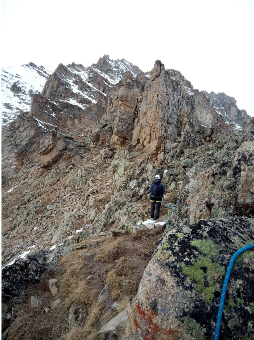
Рис.5. На участке R0-R1.