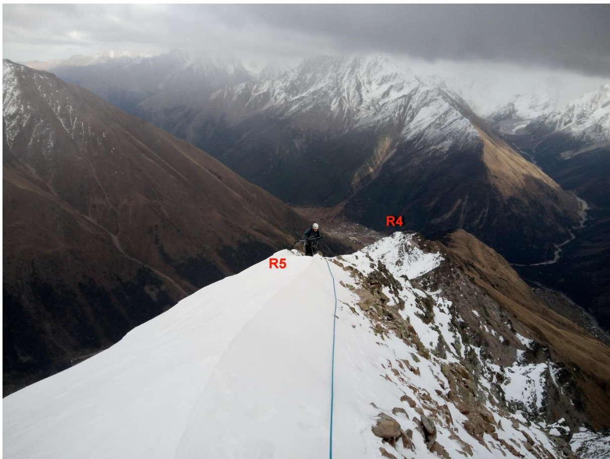
Рис.11. Предвершинный гребень. Вид сверху. R4-R5.