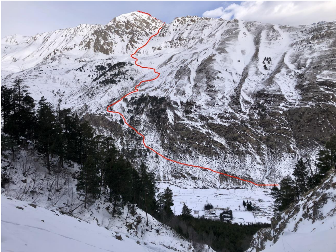
Рис.3. Путь подхода и вид на основную часть маршрута