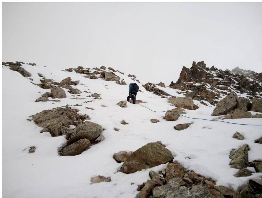
Рис.6. На участке R1-R2.