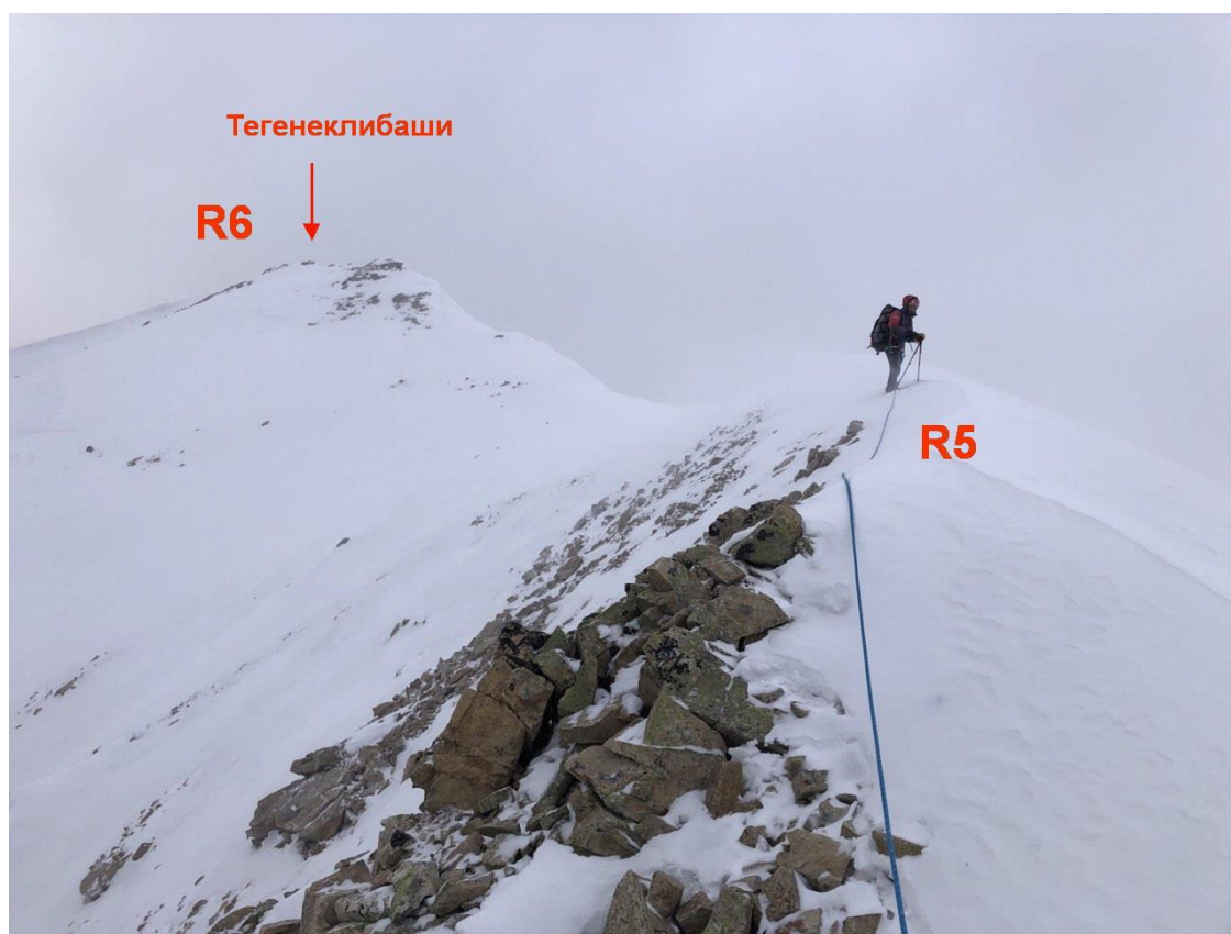
Рис.12. Предвершинный гребень. Участок R5-R6.