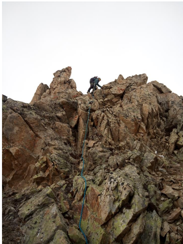
Рис.8. Выход на гребень R3.