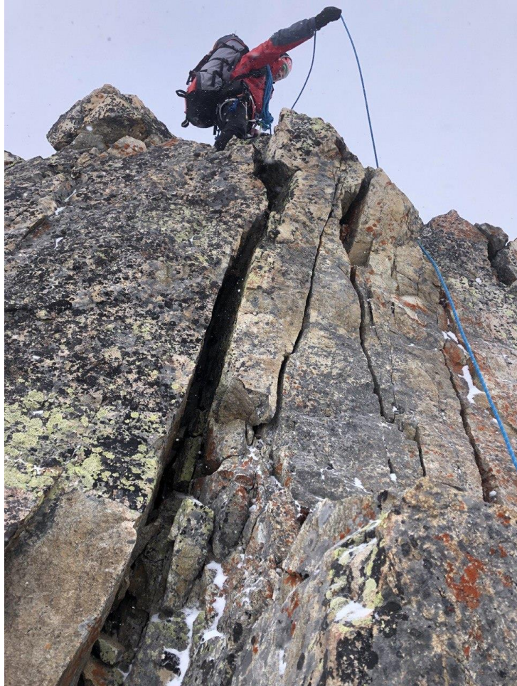
Рис.9. Ключевой участок маршрута R3-R4.