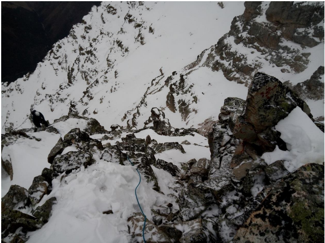
Рис.10. Начало участка R4-R5. Вид сверху.