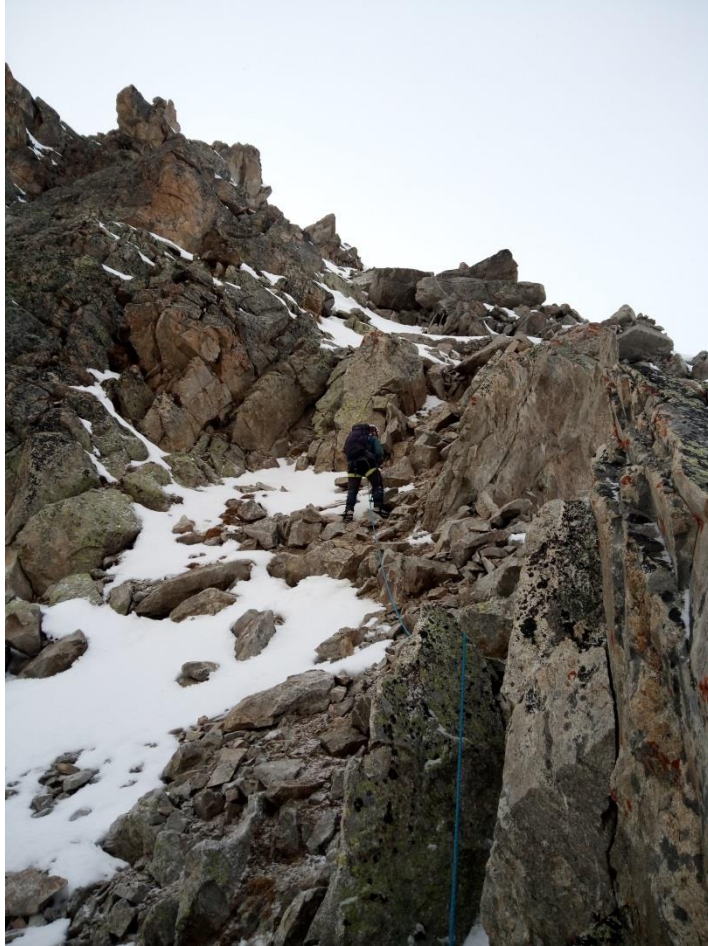
Рис.7. На участке R2-R3.