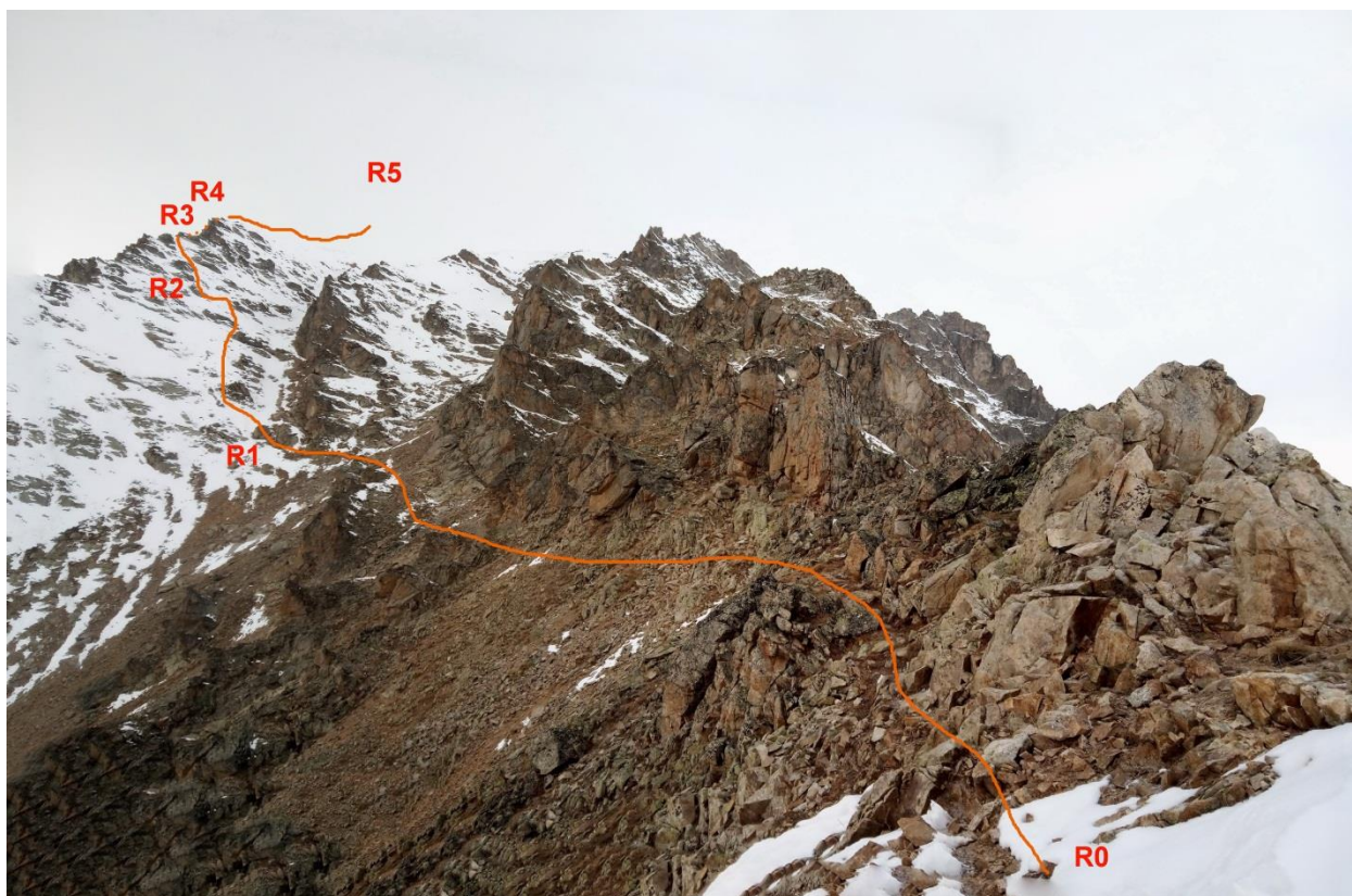
Рис.4. Техническое фото первой половины маршрута.