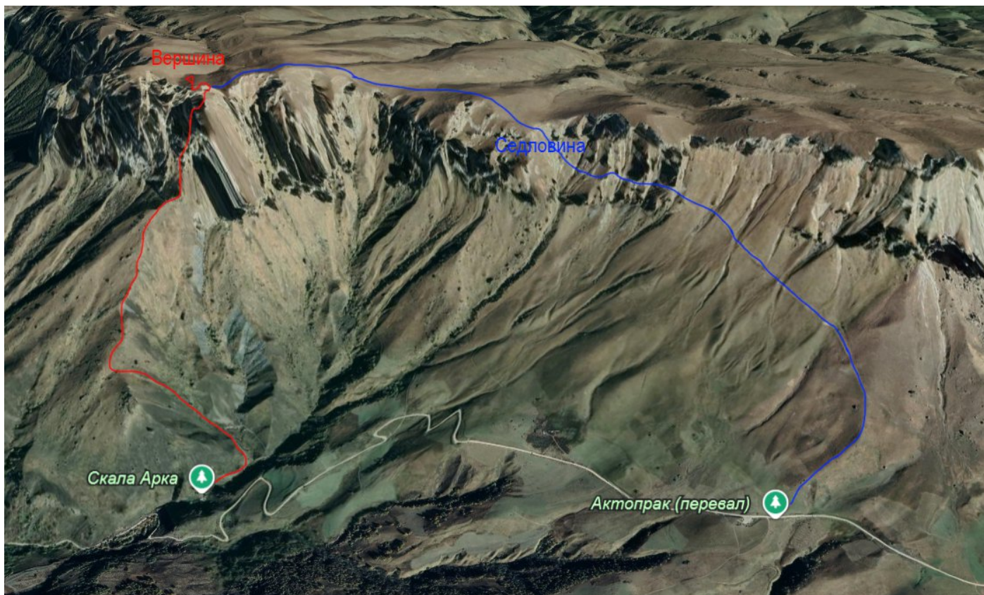
Рис.1. Скриншот района с сайта https://earth.google.com/ (снимки спутника). Красным - нитка подхода и маршрута, синим – путь спуска