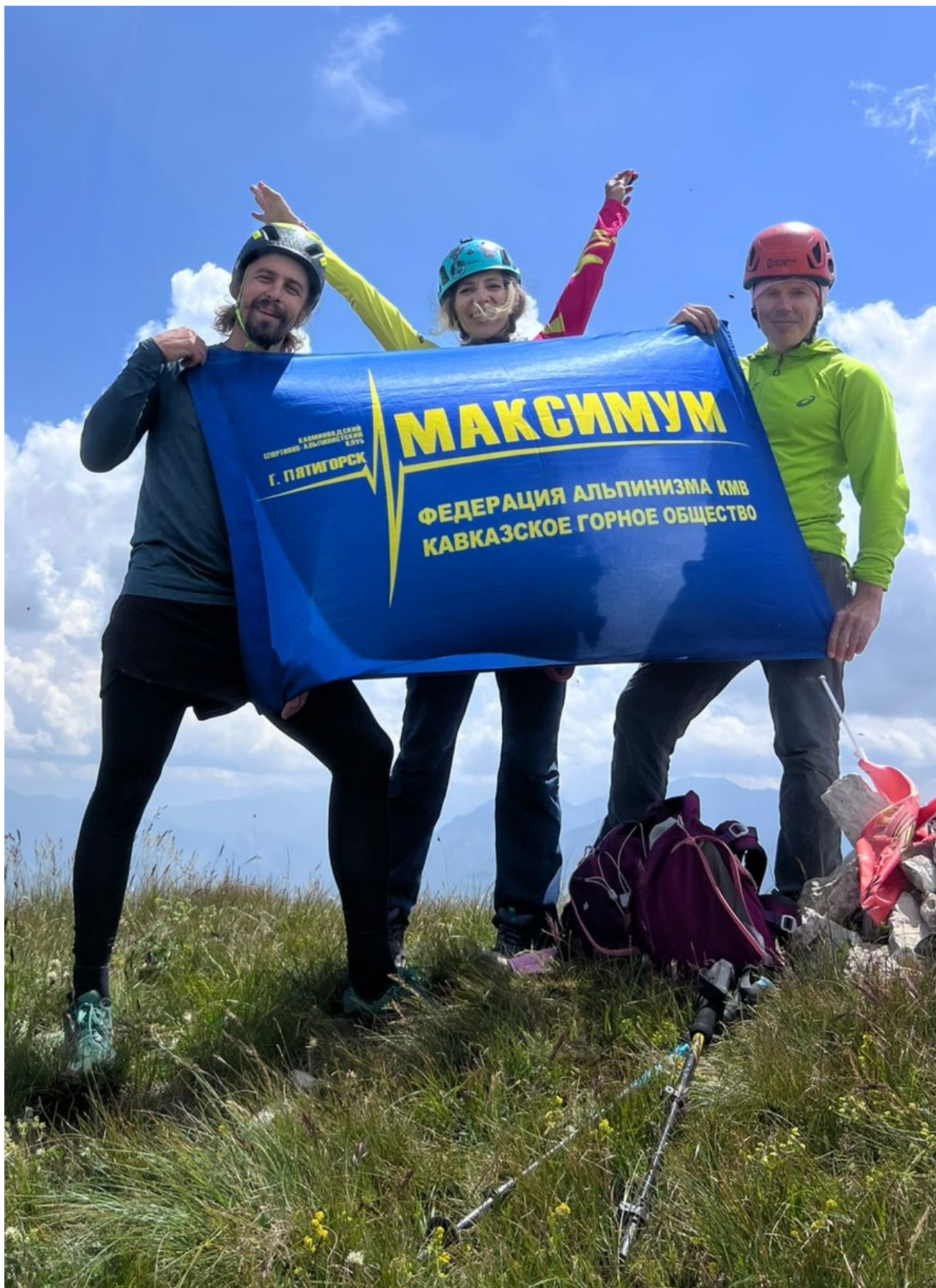
На вершине Лха 2-я Западная