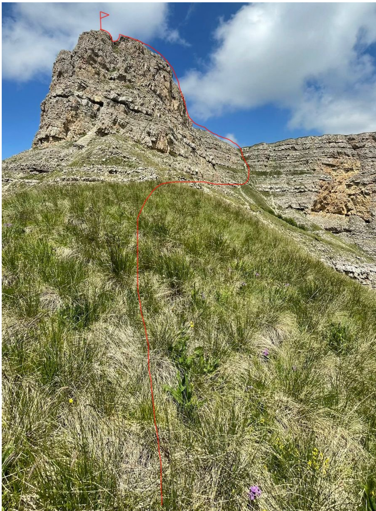
Фото №6. Участок R6-R7