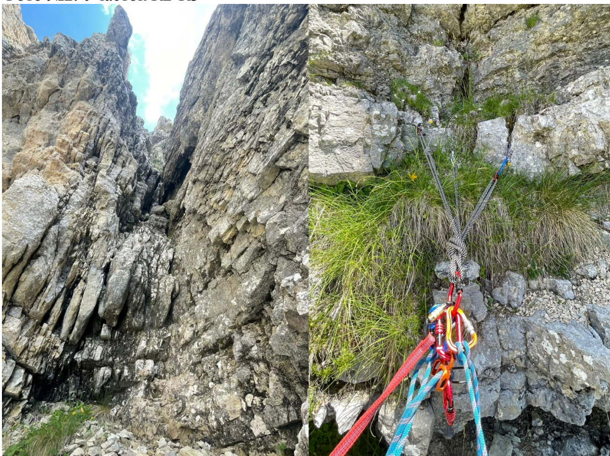
Фото №3. Участок R3-R4