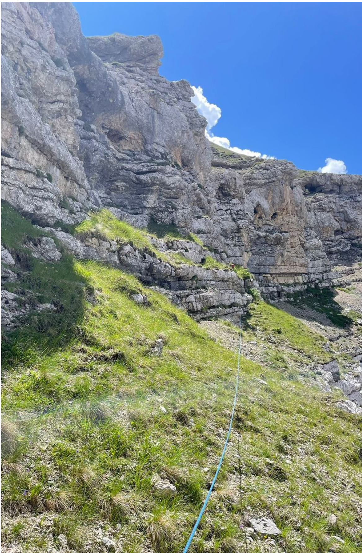
Фото №4. Участок R4-R5