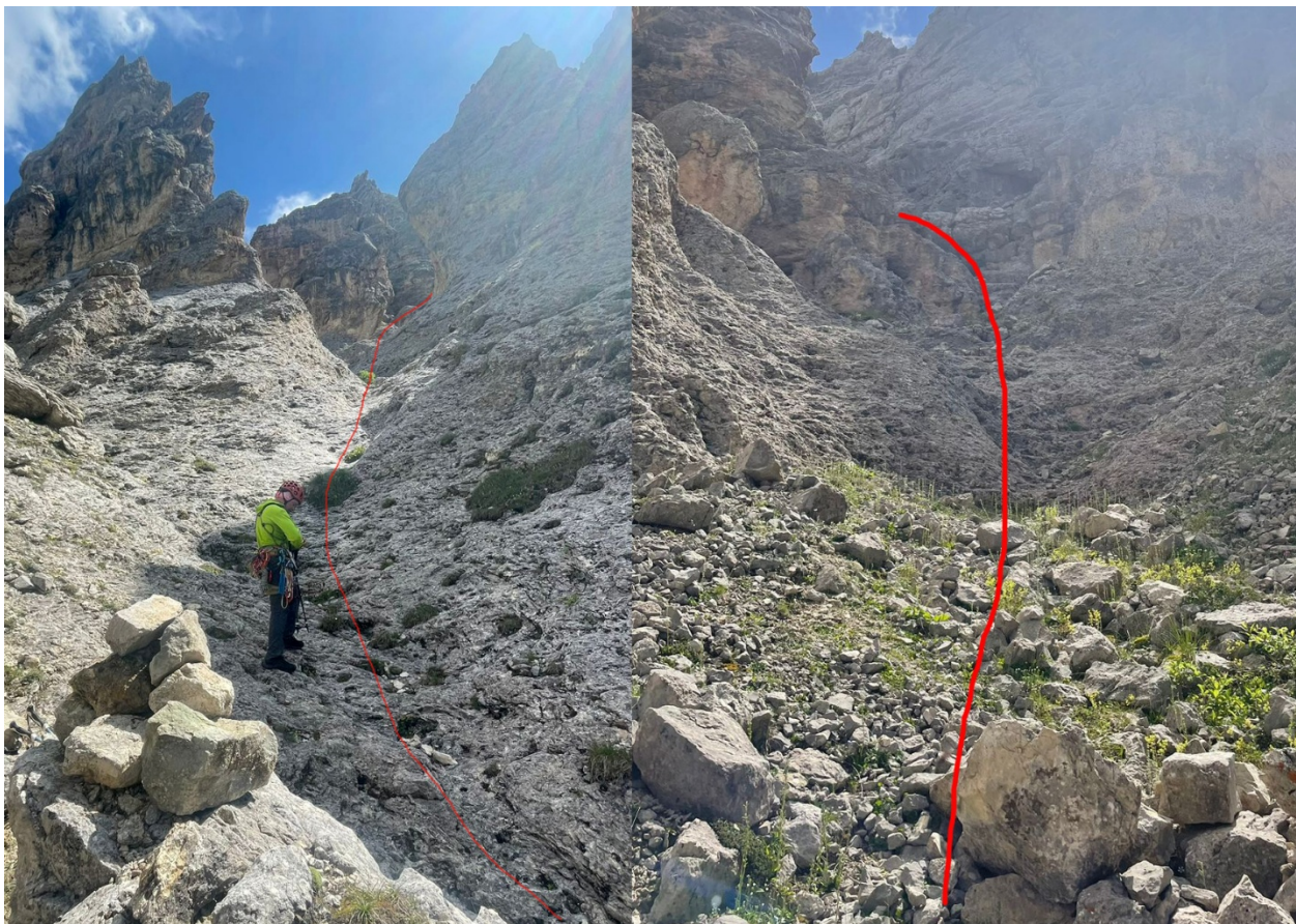
Фото №2. Участок R2-R3