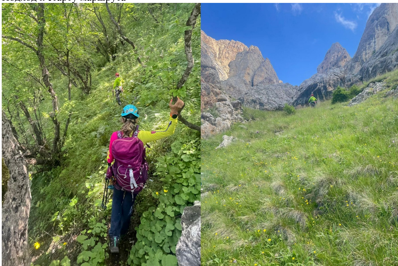
Фото №1. Участок R1-R2