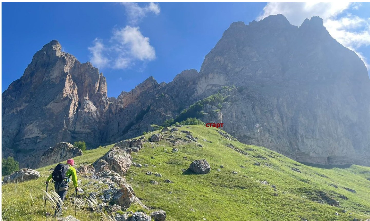
Подход к старту маршрута