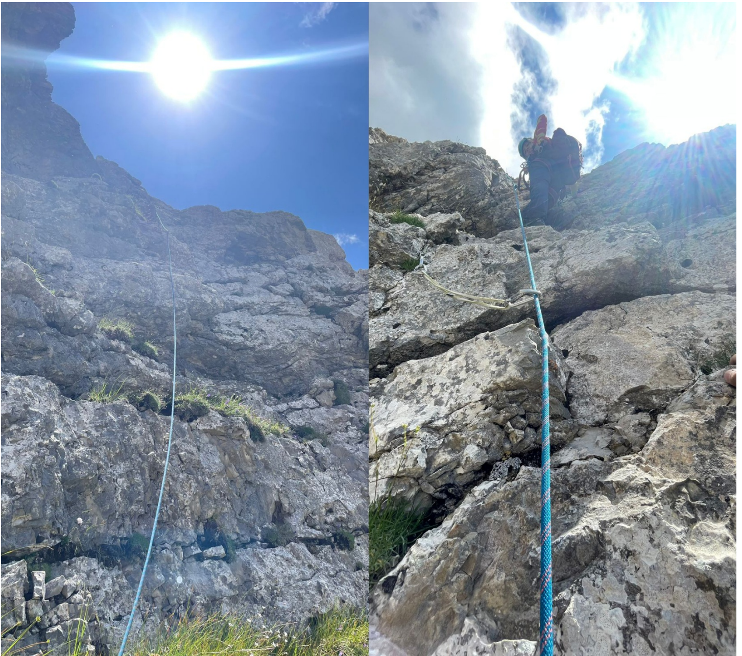
Фото №5. Участок R5-R6