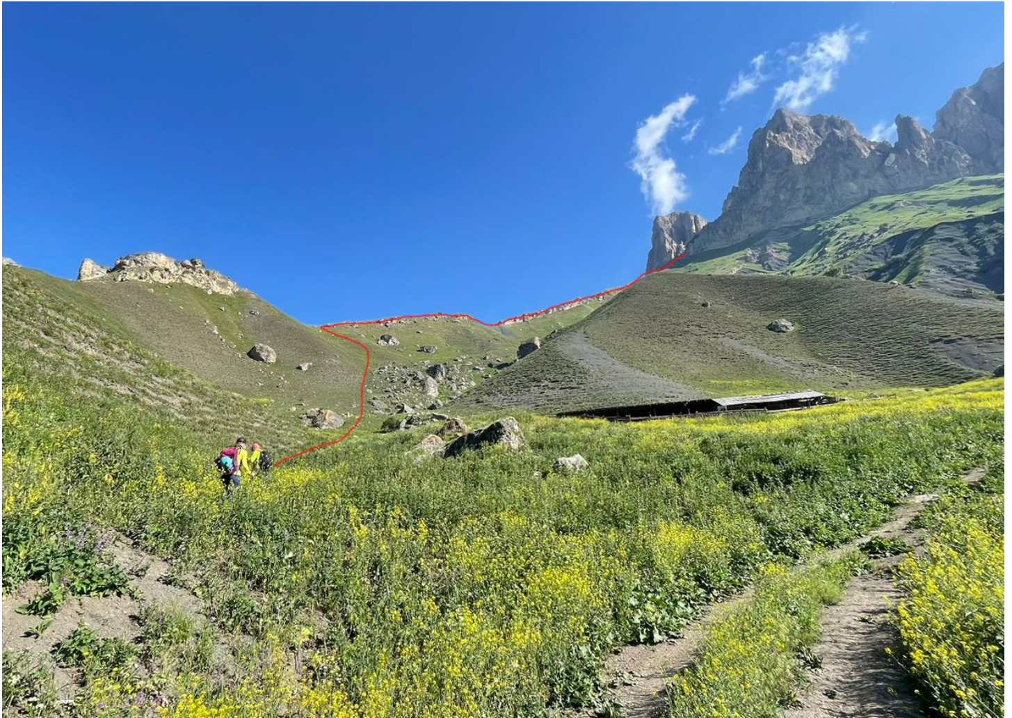
Рис. 2. Путь подхода к маршруту